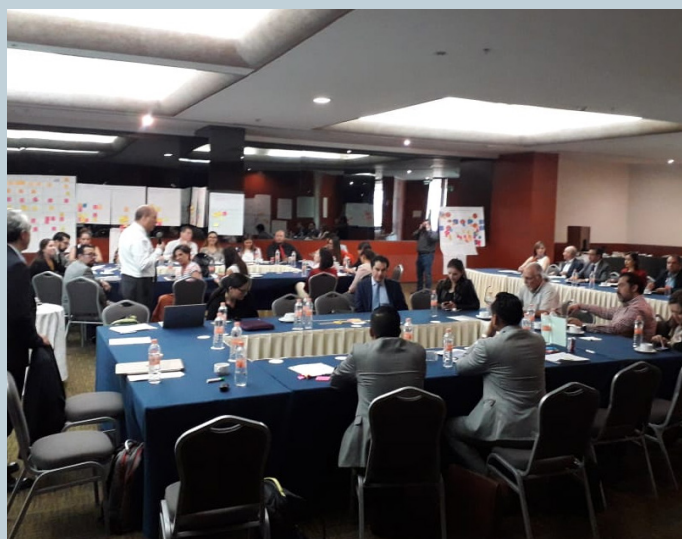
Presentación del Reto de los 100 días