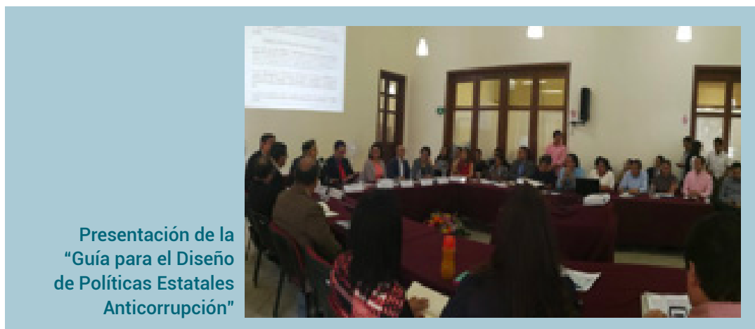
Presentación de la "Guía para el Diseño de Políticas Estatales Anticorrupción"