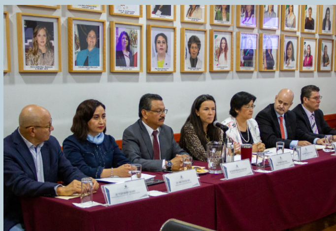
Asisten integrantes del Comité Coordinador y la Secretaría Técnica a las mesas del Foro "Reforma Estatal Anticorrupción 2.0 Jalisco"