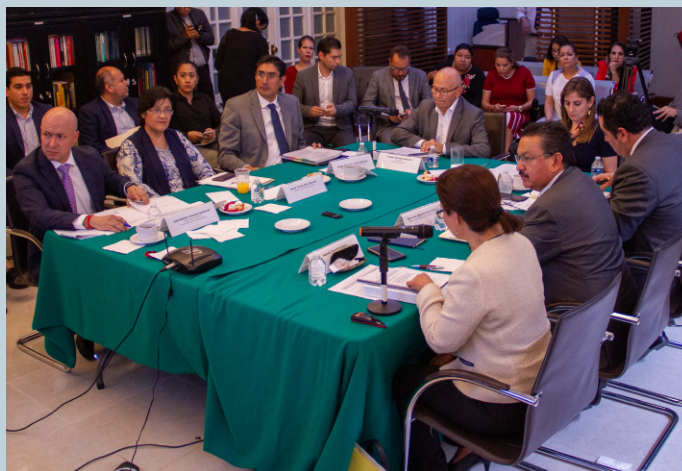
Sesión del 27 de agosto de 2019