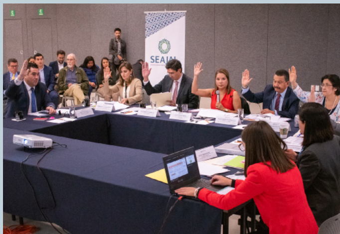
Sesión del 27 de enero de 2020