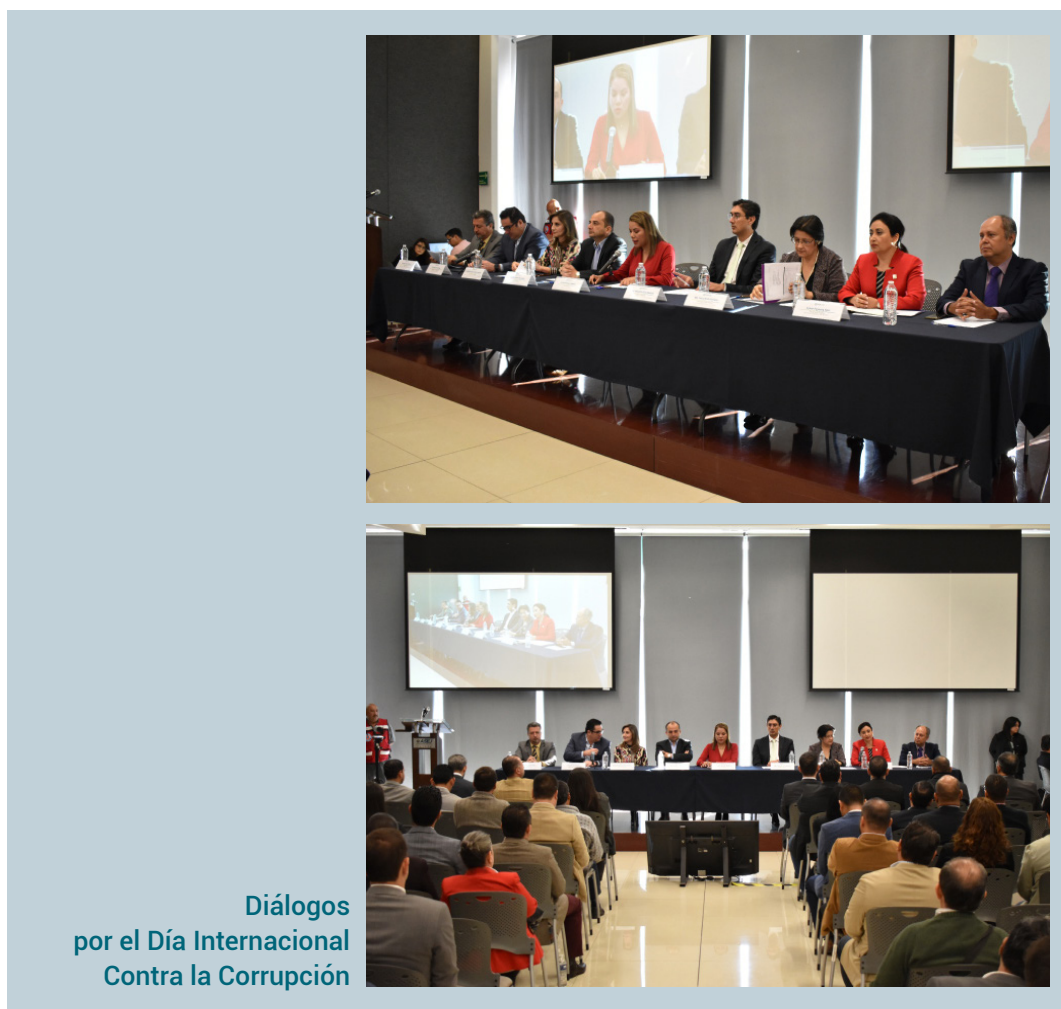
Diálogos por el Día Internacional Contra la Corrupción