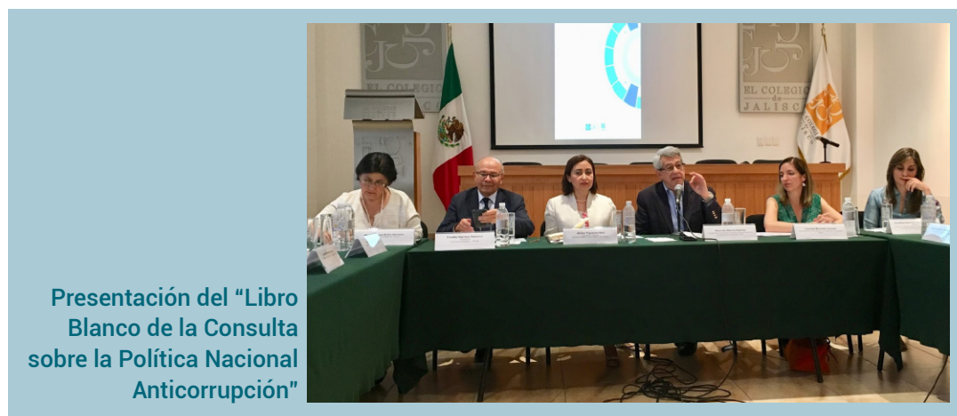
Presentación del "Libro Blanco de la Consulta sobre la Política Nacional Anticorrupción"