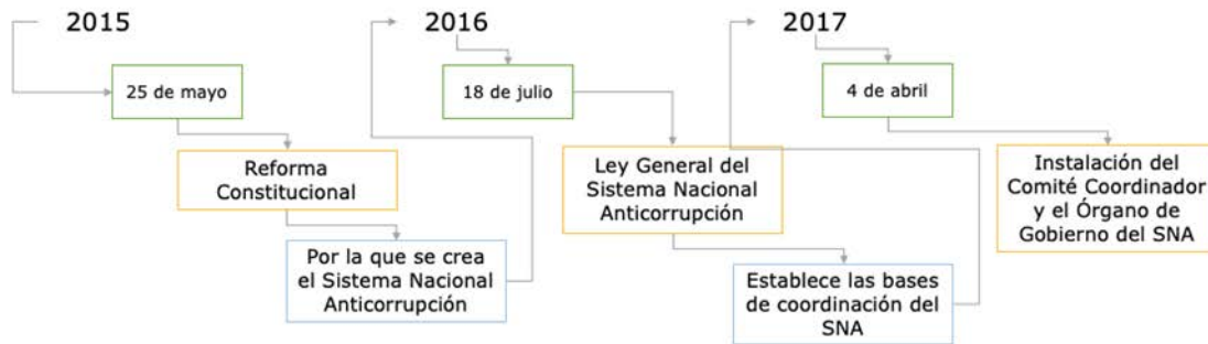
Figura 1 Antecedentes del SNA y su Comité Coordinador

La LGSNA se publicó junto con otras 3 leyes nuevas y reformas a 5 más: