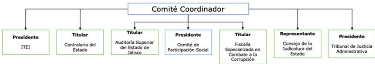
Figura 2 Instituciones integrantes del Comité Coordinador

Durante el 2018, dos instituciones del Comité Coordinador, el Tribunal de Justicia Administrativa y la Secretaría Ejecutiva del SEAJAL, realizaron abundantes