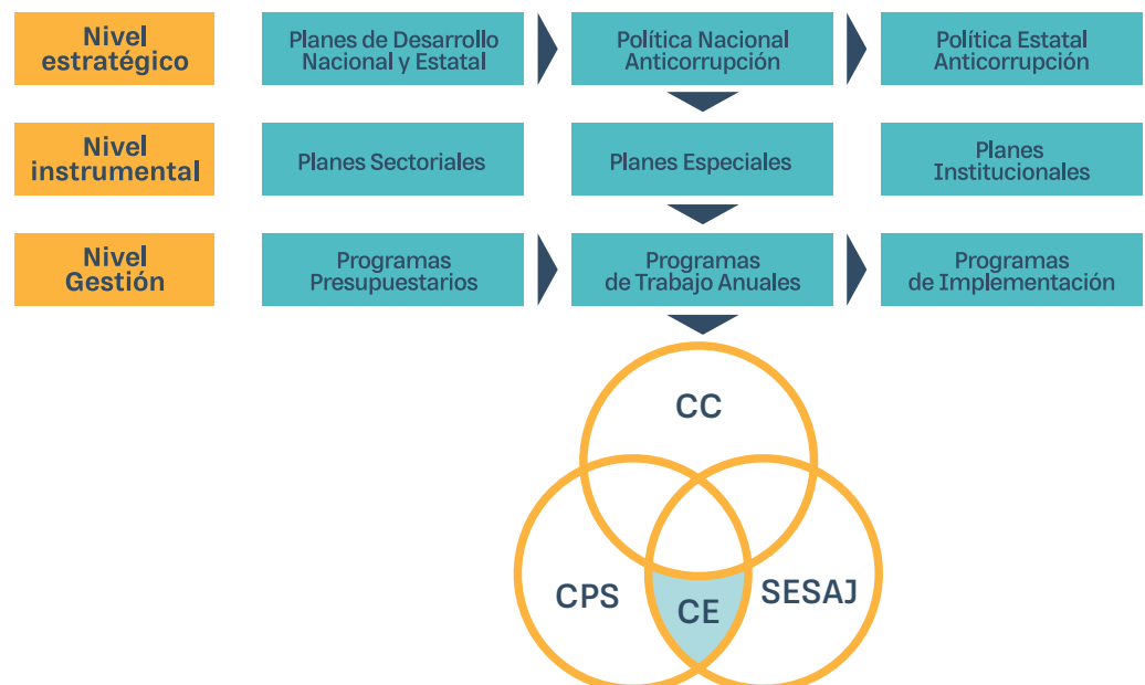
Figura 1. Alineación e interacción