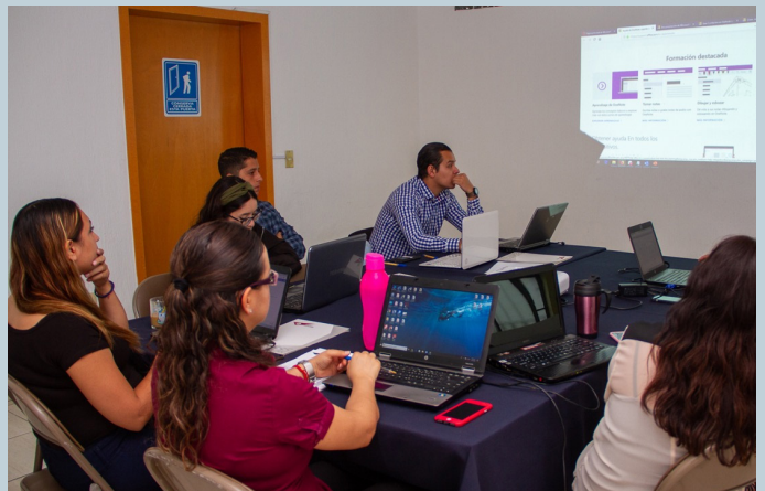
Personal de la SESAJ y del OIC en reuniones de trabajo